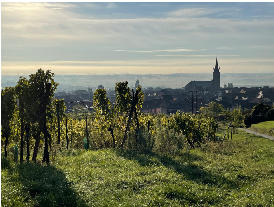
Dambach la Ville