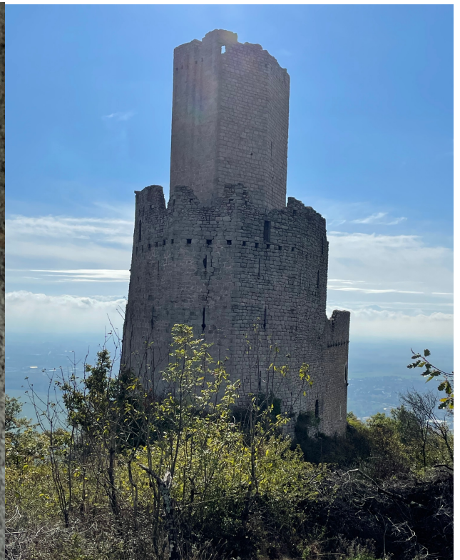
et de l'Ortenbourg