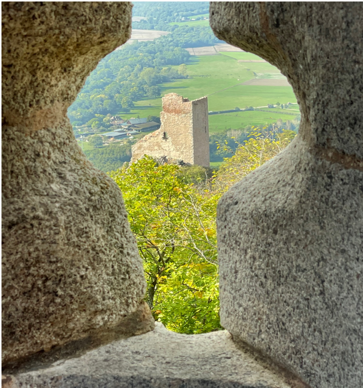
Châteaux du Ramstein