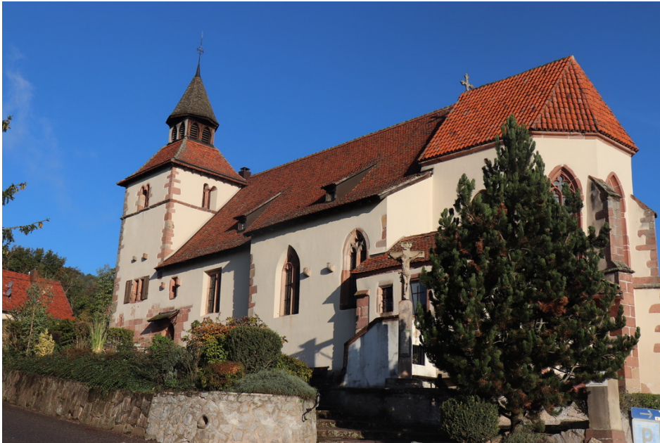
Chapelle Saint Sébastien