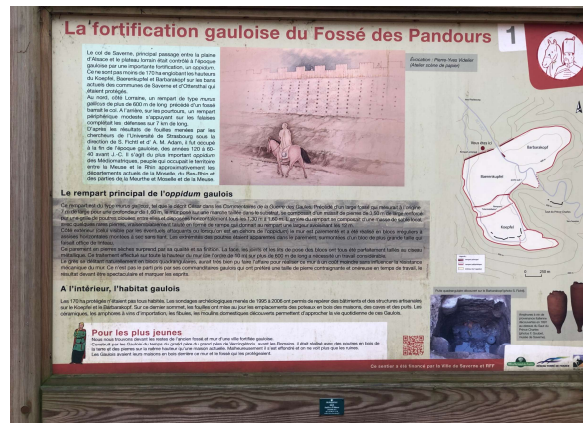
Photo 1 les tracés des chars romains au saut du prince Charles Photo 2 panneau explicatif pour l'oppidum gaulois