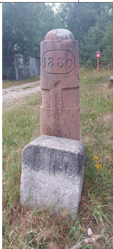
Borne frontière avec la Lorraine