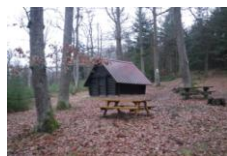
Cabane du Pain d'Epices