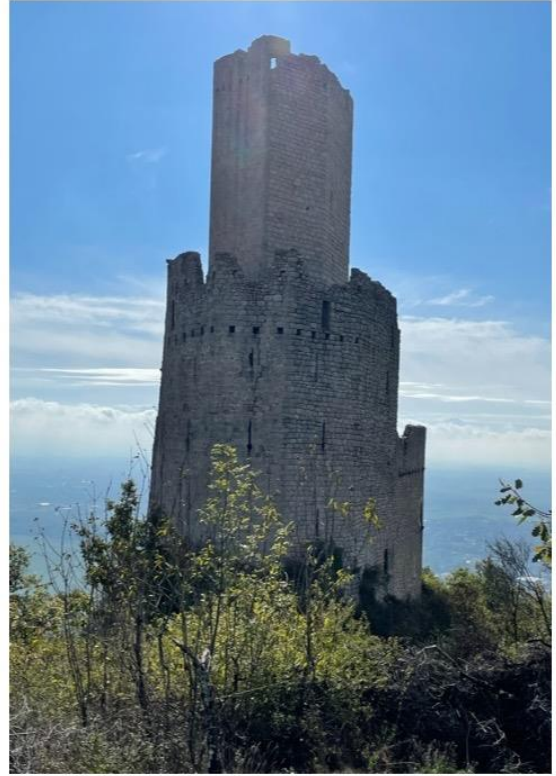
et de l'Ortenbourg