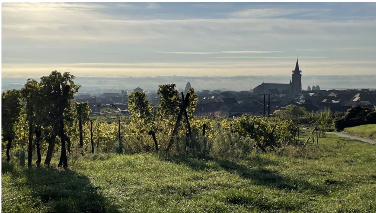
Dambach la Ville