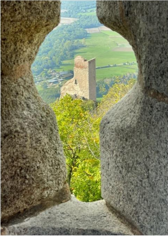
Châteaux du Ramstein