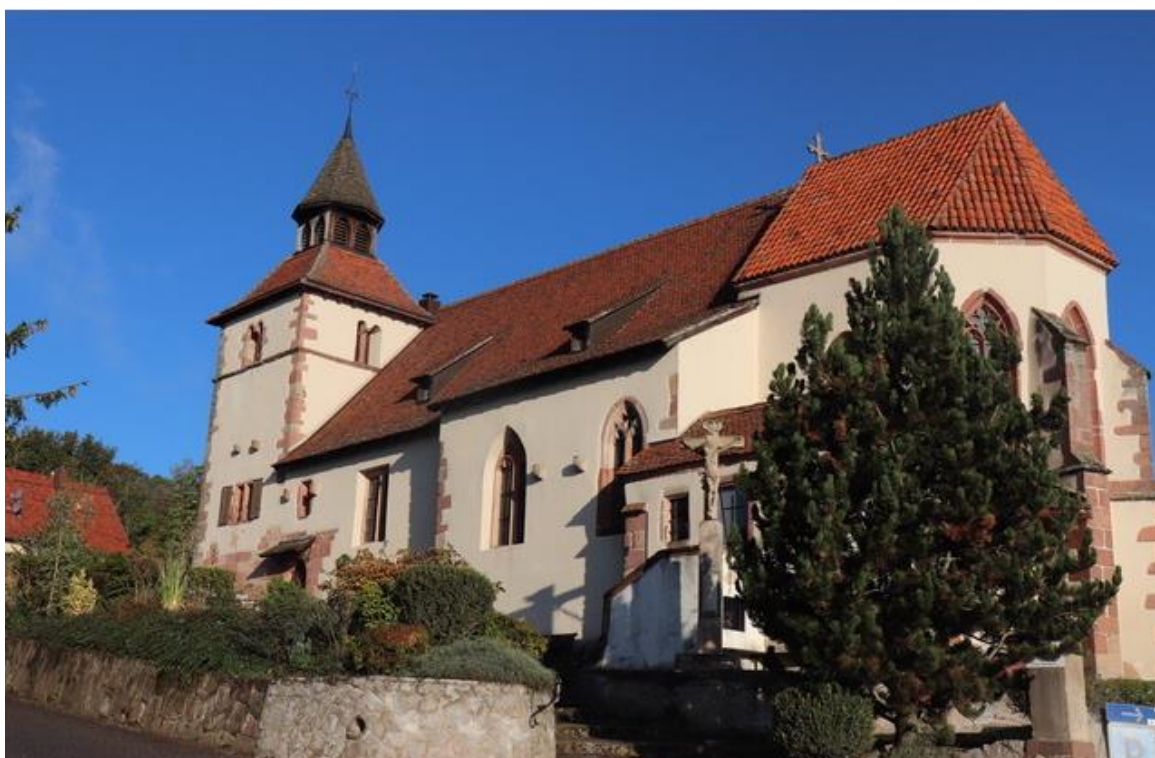
Chapelle Saint Sébastien